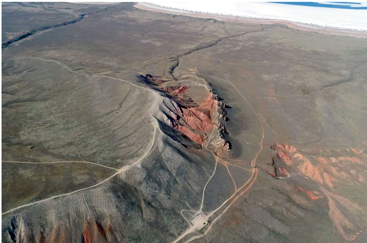
Рисунок 1 — Гора Большое Богдо — древняя солянокупольная возвышенность, являющаяся островом-рефугиумом во времена Хвалынской трансгрессии Каспийского (Хвалынского) моря

5 — к этой категории относят восстанавливаемые и восстанавливающиеся таксоны. Такие таксоны появились на территории Богдинско-Баскунчакского солянокупольного района после создания в 1997 г. на его территории заповедника «Богдинско-Баскунчакский». Прежде всего, это виды рода тюльпан ( Tulipa L.), четыре вида которых представлены во флоре изученного района.