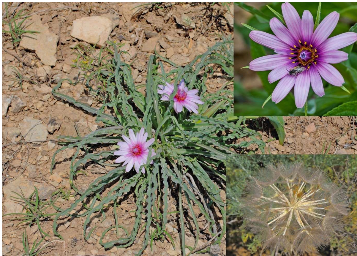
Рисунок 2 — Козлобородник окаймлённолиственный ( Tragopogon marginifolius Pavl.)

лен одной дизъюнктивной реликтовой популяцией в России, расположенной на г. Большое Богдо. Его редкость на территории Прикаспийской низменности определена сложившимися историческими факторами, имевшими место во времена Хвалынской трансгрессии Каспийского моря.