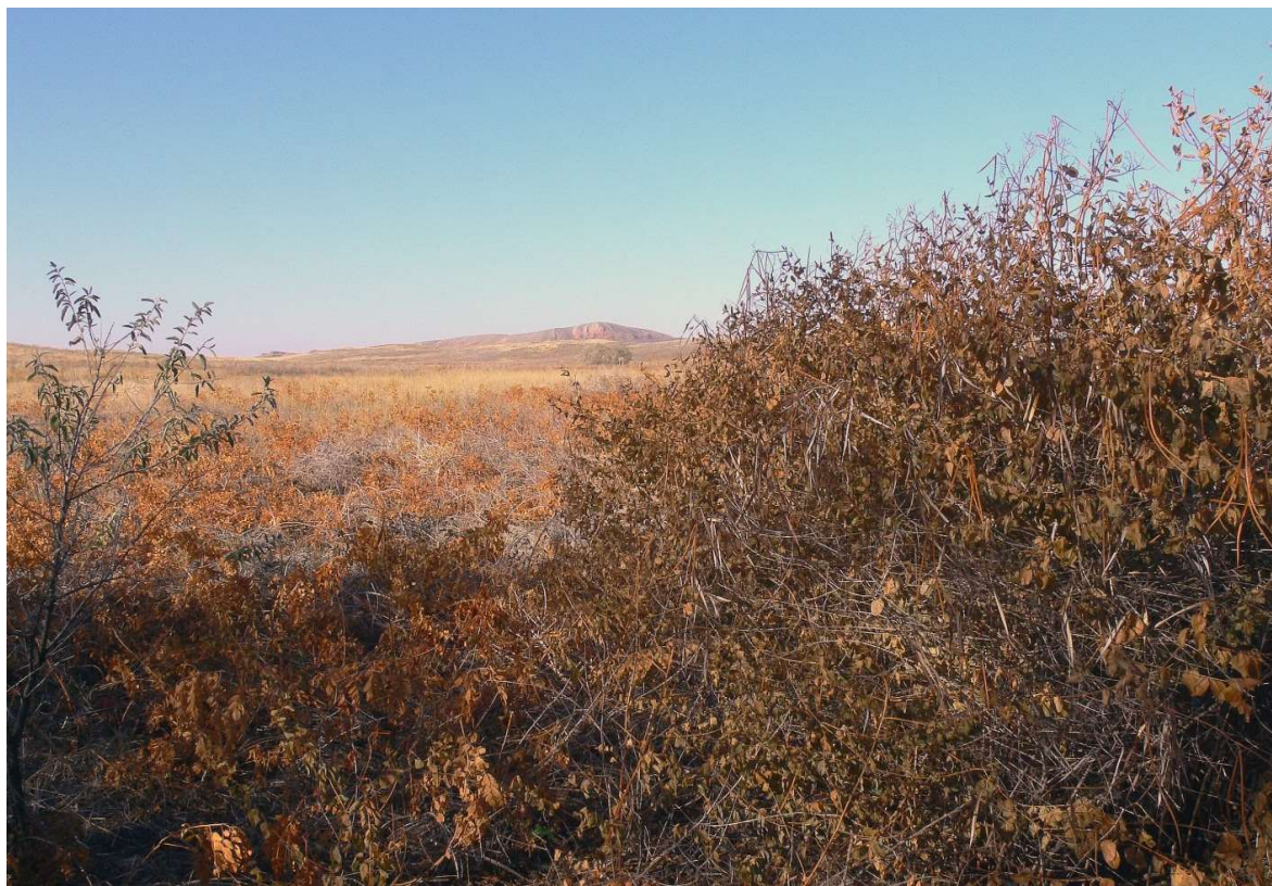
Рисунок 3 — Эндемик Богдинско-Баскунчакского солянокупольного района поацинум Казакевича ( Poa cynum kazakevichchii E. Mavrodiev, A. Laktionov & Yu. Alexeev) (справа) в урочище Шарбулак ( locus classicus ). На заднем плане — южный и юго-восточный склоны г. Б. Богдо

В категорию L мы включили виды растений, которые были описаны на территории Богдинско-Баскунчакского солянокупольного района — своего классического местонахождения ( locus classicus ). В категорию L включены виды растений, имеющие как широкий ареал, так и узколокальные эндемики. Например наиболее интересным и своеобразным представителем категории L является эндемик Богдинско-Баскунчакского солянокупольного района поацинум Казакевича ( Poa cynum kazakevichchii E. Mavrodiev, A. Laktionov & Yu. Alexeev), весь ареал которого занимает небольшое понижение среди хвалынских песчаных массивов и выходов карста на дневную поверхность в урочище Шарбулак (рис. 3) [23].